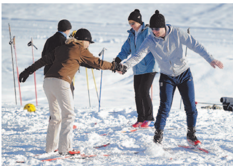
Übung: Vertraut machen im Umgang mit den Langlaufskiern.