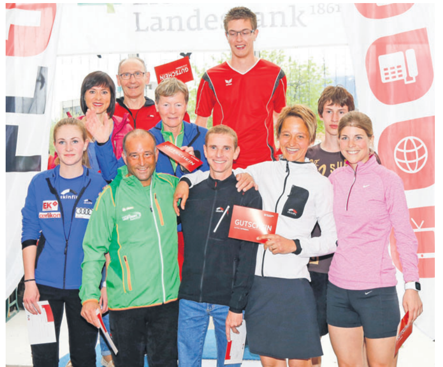
Voller Erfolg: Der Vaduzer Städtlelauf begeisterte alle Aktiven und Zuschauer.