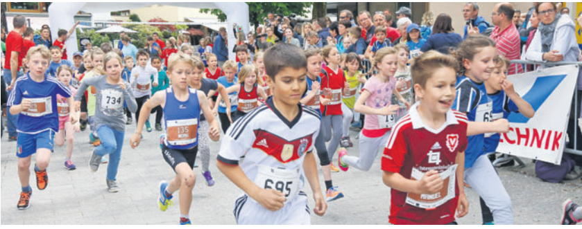
Auch die jüngsten Teilnehmer zeigten beim Städtlelauf tolle Leistungen.